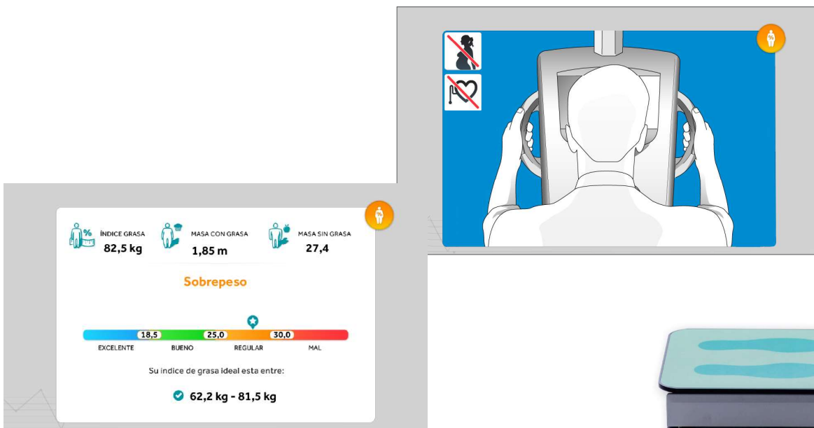
Ejemplos de pantallas